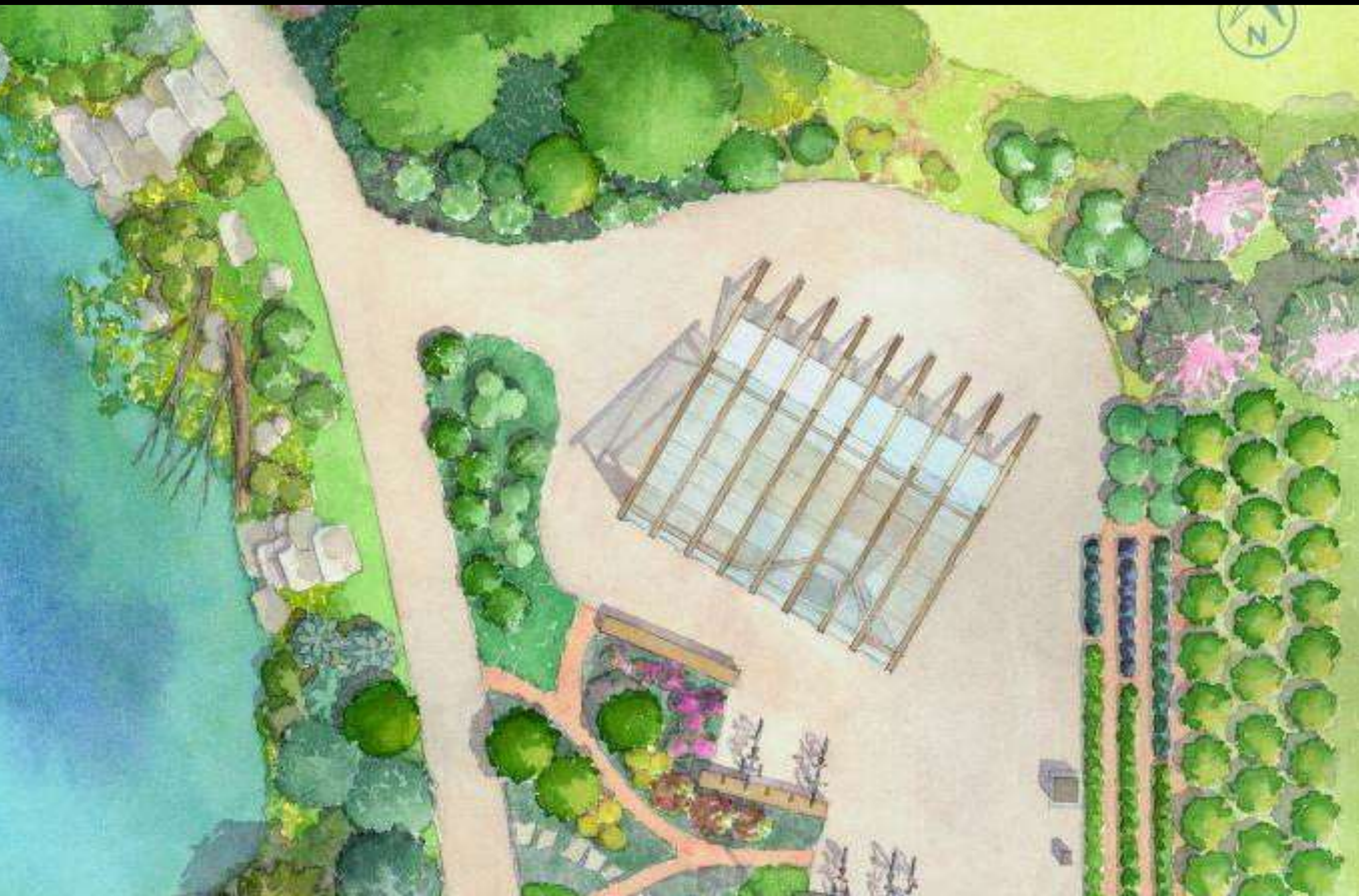
Skovhaven ved supercykelstien tegnet af Christy Hempel